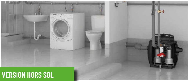
VERSION HORS SOL