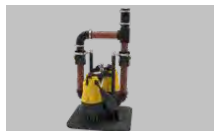
Pompen niet inbegrepen in de leveringsomvang