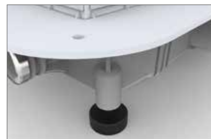
Pieds en caoutchouc pour la réduction sonore