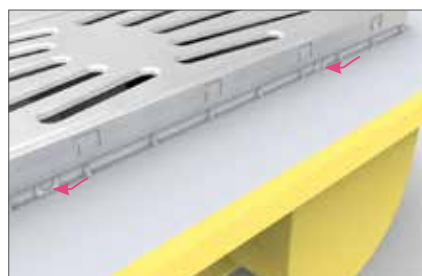
Drainage secondaire à ouvrir si besoin