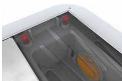
Revêtement/clapet anti-retour de l'entrée latérale réglable en hauteur